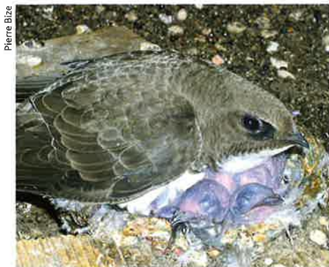
Les martinets alpins ( Apus melba ) nichent sous les toits des hauts édifices.

Animal Behaviour , (2006), 72, pp. 539-544